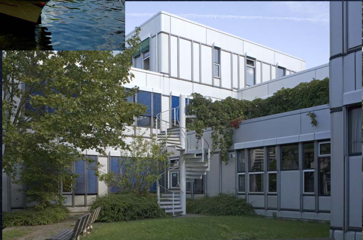
Freie Universität Berlin