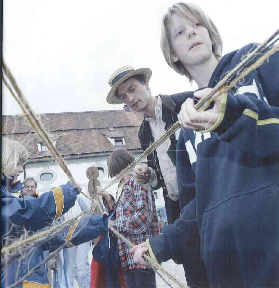
Vielfältige Attraktionen bietet das Lernfest im Kloster Benediktbeuern

Das Jahr 2008 bringt für zwei Lernende Regionen eine öffentliche Anerkennung ihrer Leistungen mit sich: Die Lernende Region Tölzer Land und das LernNetz Berlin-Brandenburg gehen mit ihren Bildungsinnovationen als Preisträger aus dem diesjährigen Wettbewerb „Deutschland – Land der Ideen“ hervor. Sie sind damit zwei von 366 ausgewählten Orten im Schaltjahr, mit denen die gemeinsame Standortinitiative von Bundesregierung und deutscher Wirtschaft unter der Schirmherrschaft von Bundespräsident Horst Köhler Ideen auszeichnet, „die in die Zukunft tragen“. So sind nunmehr drei