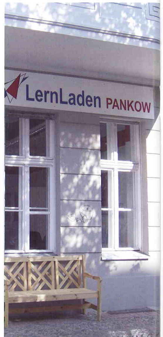
Die LernLäden in Königs Wusterhausen (Brandenburg, links) und Berlin-Pankow (rechts)

von Menschen aus allen Alters- und Bevölkerungsgruppen Lernangebote und -inhalte aus ihrer Region erleben, selber aktiv werden, sich ausprobieren und Erfolge feiern können.